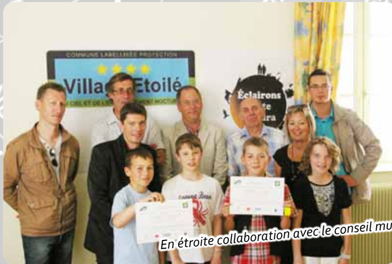
En étroite collaboration avec le conseil municipal des jeunes...

Cette extinction se fait aussi pour préserver l'environnement car de nombreuses espèces animales sont exclusivement nocturnes pour tout ou partie de leur cycle de développement. Pour ces espèces du noir, la nuit a valeur d'habitat et d'elle dépend leur survie. (exemple le petit murin, chauve-souris en voie de disparition, dont le nombre est passé de 5 à 6 couples peut-être grâce à cette mesure).